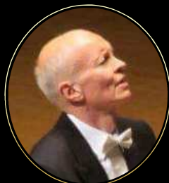
ローナン・マギル / ピアノ Ronan Magill / Piano