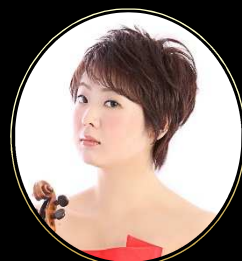
泉 里沙 / ヴァイオリン Risa Izumi / Violin