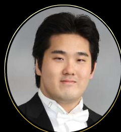
新海 康仁 / テノール Yasuhito Shinkai / Tenor